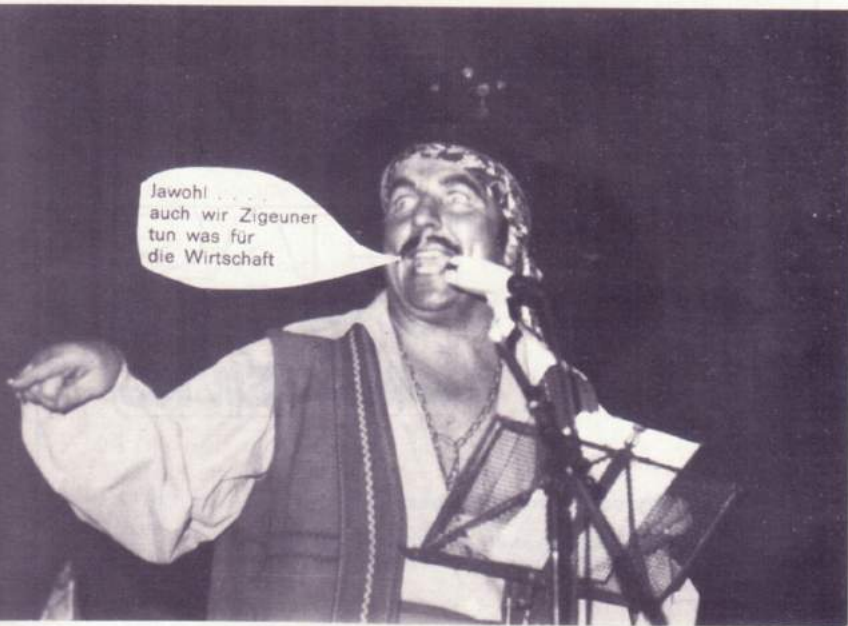
← → unter sich

Wir bleiben auf der Erde, wir fahrn nicht auf den Mond. Da gibt es kein Bierchen zu trinken, ja, die Reise sich nicht lohnt. Wir bleiben auf der Erde, wir fahrn nicht auf den Mond. Da gibt es kein Bierchen zu trinken, ja, die Reise sich nicht lohnt.