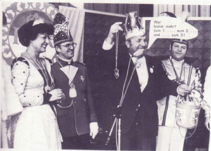
Unsere Freunde aus Gießen