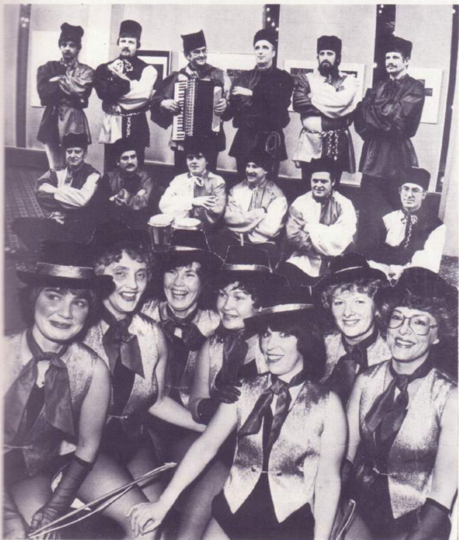
nicht wegzudenkende Höhepunkte