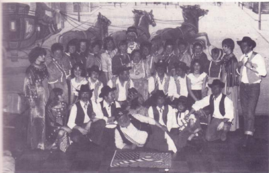
Die Hofheimer Gäste