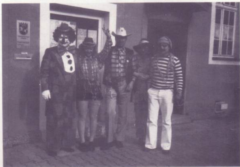
Freunde und Helfer