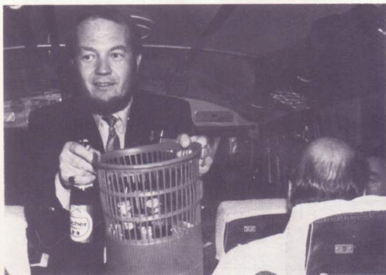
Er sammelt für Aschermittwoch