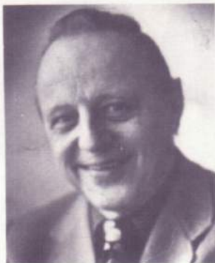
Ein Dank der Tagespresse