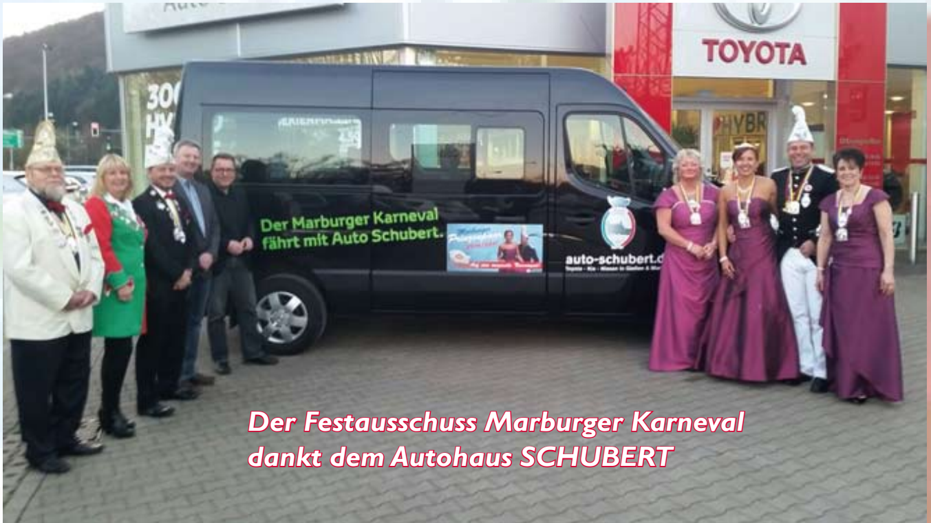
Der Festausschuss Marburger Karneval dankt dem Autohaus SCHUBERT