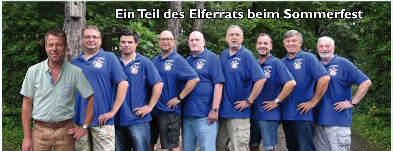
Ein Teil des Elferrats beim Sommerfest

Ab diesem Zeitpunkt bis zum Aschermittwoch regieren in Marburg die Tollitäten.